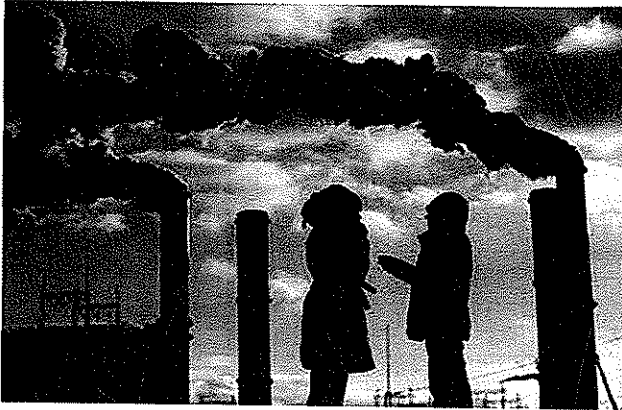
Khí thải nhà máy là thủ phạm gây biến đổi khí hậu.

4. WMO & UNEP, 2001 Special Report on Emissions Scenarios. Trong tập "IPCC Special Report on Climate Change. Cambridge University Press.