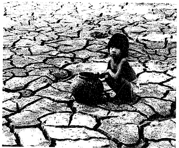
Hạn hán - biểu hiện cụ thể của biến đổi khí hậu.